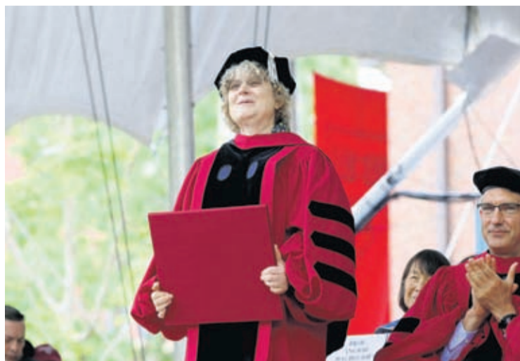
(AP) — Un team internacional di matematico kende nan teoriaran a yuda mehora compre-

sion di filenan grandi di data, incluyendo imagen y zonido, lo ricibi reconocemento cu un di e premionan mas prestigioso den mundo di habla Hispano.